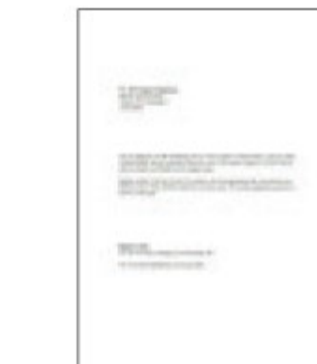
#1 ข้อความสีดำ

*1 ความเร็วการพิมพ์ (หน้าต่อนาที) คำนวณจากการพิมพ์บนกระดาษธรรมดา A4 ในโหมดที่เร็วที่สุด ความเร็วในการพิมพ์อาจแตกต่างกันไปขึ้นอยู่กับข้อกำหนดของระบบ, โหมดการพิมพ์, ความซับซ้อนของเอกสาร, ซอฟต์แวร์, ประเภทของกระดาษที่ใช้ และการเชื่อมต่อ ความเร็วในการพิมพ์โดยรวมเวลาประมวลผลของคอมพิวเตอร์เครื่องที่สั่งพิมพ์