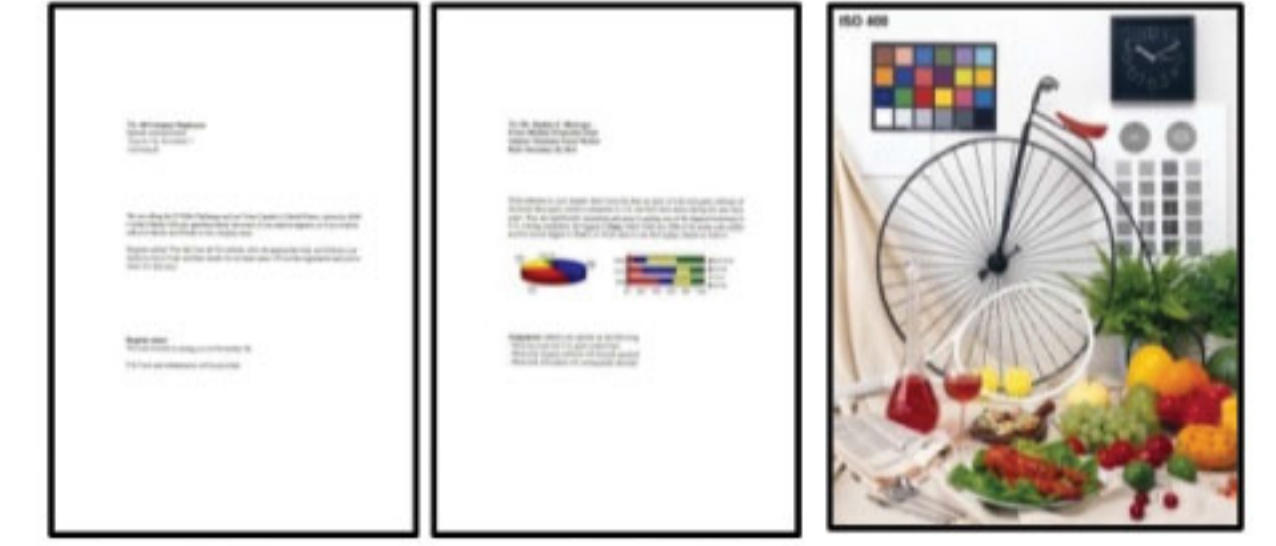
#1 ข้อความสีดำ #2 สี #3 ภาพถ่าย 4R

*1 ความเร็วการพิมพ์ (หน้าต่อนาที) ค่าเฉลี่ยจากการพิมพ์บนกระดาษธรรมดา A4 ในโหมดที่เร็วที่สุด, ความเร็วในการพิมพ์ภาพถ่าย 10x15 ซม. เมื่อพิมพ์บนกระดาษภาพถ่าย Epson Premium Glossy Photo Paper ความเร็วในการพิมพ์อาจแตกต่างกันไปขึ้นอยู่กับข้อกำหนดค่าของระบบ, โหมดการพิมพ์, ความชื้นของกระดาษ, ช่องต่อ, ประเภทของกระดาษที่ใช้และการเชื่อมต่อ ความเร็วในการพิมพ์รวมเวลาประมวลผลของคอมพิวเตอร์เครื่องที่ส่งพิมพ์