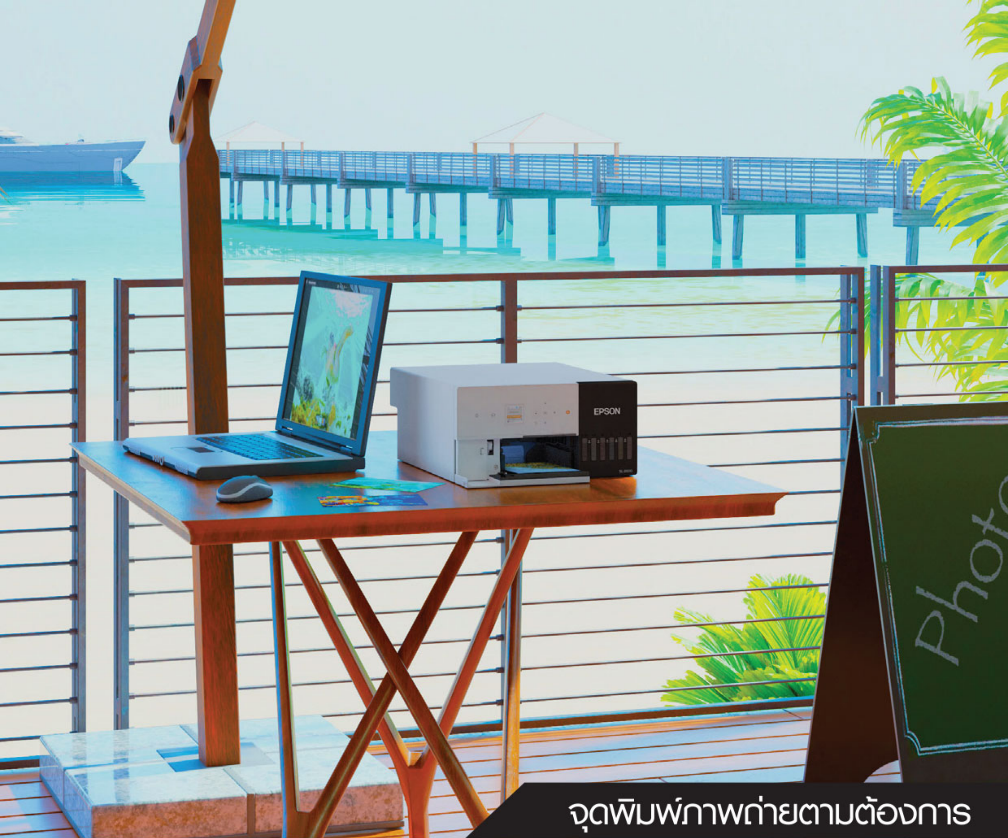
จุดพิมพ์ภาพถ่ายตามต้องการ