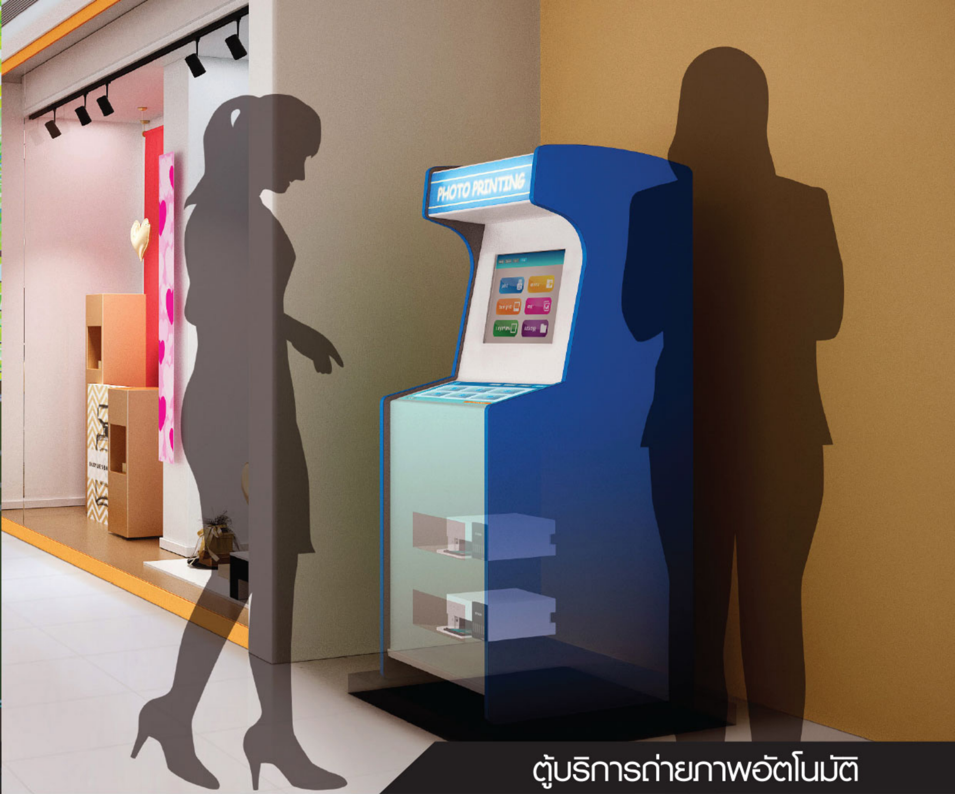
ตู้บริการถ่ายภาพอัตโนมัติ