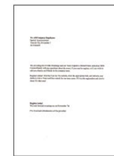
#1 ข้อความสีดำ และกราฟิก

*1 ความเร็วการพิมพ์ (หน้าต่อนาที) กำหนดจากการพิมพ์แบบกระดาษธรรมดา A4 ในโหมดที่เร็วที่สุด ความเร็วในการพิมพ์อาจแตกต่างกันไปขึ้นอยู่กับโหมดการพิมพ์, โหมดการพิมพ์, ความหนาของกระดาษ, ช่องต่อ, ประเภทของกระดาษที่ใช้ และการเชื่อมต่อ ความเร็วในการพิมพ์โดยรวมอาจแตกต่างกันไปขึ้นอยู่กับขนาดของกระดาษที่ส่งผ่าน