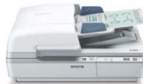
WorkForce DS-6500 25ppm/50ipm

สแกนเนอร์ WorkForce ขนาด A4 รุ่นใหม่ล่าสุดจากเอปสัน ให้คุณภาพมากขึ้นและเชื่อถือได้ ด้วยอุปกรณ์มือเอกสารอัตโนมัติถึง 100 แผ่นในตัวเครื่อง มีอัตราการสแกนสูงถึง 3,000 หน้าต่อวัน สำหรับรุ่น DS-6500 และ 4,000 หน้าต่อวัน สำหรับรุ่น DS-7500 ให้ประสิทธิภาพการสแกนที่เร็วสุดถึง 40 หน้าต่อาที/80 ภาพต่อาที สำหรับรุ่น DS-7500 ในตัวสแกนเนอร์ประกอบด้วย Document Capture Pro Software ซึ่งมีฟังก์ชันสแกนเพื่อพิมพ์, สแกนจากออนไลน์ ฮีเมล และ FTP เพื่อจัดการเอกสารทำได้อย่างรวดเร็วและง่ายดาย