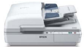
WorkForce DS-7500 40ppm/80ipm