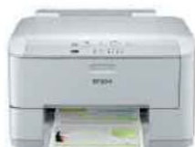
WorkForce Pro WF-4011

ปรับปรุงผลงานของคุณด้วยเครื่องพิมพ์ที่รองรับเครือข่าย WorkForce Pro WF-4011 ให้คุณทำพริ้นด้วยค่าใช้จ่ายในการพิมพ์ที่ถูกลง