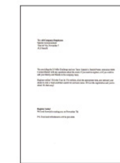
#1 ข้อความตั้งค่า แลกรภาพฟ้า

*1 ความเร็วการพิมพ์ (หน้าต่อนาที) ค่าเบี่ยงเบนจากการพิมพ์บนกระดาษธรรมดา A4 ในโหมดที่เร็วที่สุด ความเร็วในการพิมพ์อาจแตกต่างกันไปขึ้นอยู่กับข้อกำหนดของระบบ, โหมดการพิมพ์, ความซับซ้อนของเอกสาร, เซฟต์แวร์, ประเภทของกระดาษที่ใช้ และการเชื่อมต่อ ความเร็วในการพิมพ์โดยรวมอาจแตกต่างกันไปของคอมพิวเตอร์เครื่องที่ส่งพิมพ์