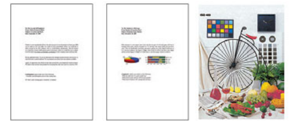
#1 ข้อความสีดำ #2 ข้อความสีดำและกราฟิก #3 ภาพถ่าย 4R (4"x6")

*1 ความเร็วการพิมพ์ (หน้าต่อนาที) คำนวณจากการพิมพ์บนกระดาษธรรมดา A4 ในโหมดที่เร็วที่สุด, ความเร็วการพิมพ์ภาพถ่าย 10x15 ซม. เมื่อพิมพ์บนกระดาษภาพถ่าย Epson Premium Glossy Photo Paper ความเร็วในการพิมพ์อาจแตกต่างกันขึ้นอยู่กับวิธีการกำหนดค่าของระบบ, โหมดการพิมพ์, ความซับซ้อนของเอกสาร, ซอฟต์แวร์, ประเภทของกระดาษที่ใช้และการเชื่อมต่อความเร็วในการพิมพ์ไปรวมเวลาประมวลผลของคอมพิวเตอร์เครื่องที่ส่งพิมพ์