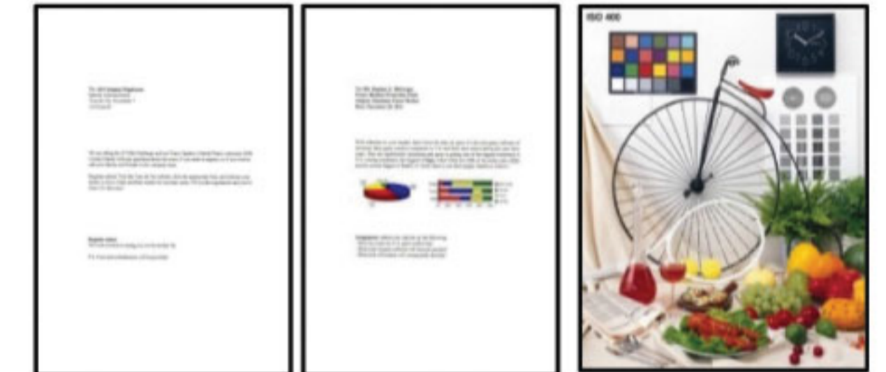
#1 ข้อความสีดำ #2 สี #3 ภาพถ่าย 4R

*1 ความเร็วการพิมพ์ (หน้าต่อนาที) คำนวณจากการพิมพ์บนกระดาษธรรมดาขนาด A4 ในโหมดที่เร็วที่สุด, ความเร็วการพิมพ์ภาพถ่าย 10x15 ซม. เมื่อพิมพ์บนกระดาษภาพถ่าย Epson Premium Glossy Photo Paper ความเร็วในการพิมพ์อาจแตกต่างกันไปขึ้นอยู่กับข้อกำหนดของระบบ, โหมดการพิมพ์, ความเร็วเริ่มต้นของเอกสาร, ซอฟต์แวร์, ประเภทกระดาษที่ใช้ และการเชื่อมต่อ ความเร็วในการพิมพ์ไม่รวมเวลาประมวลผลของคอมพิวเตอร์เครื่องที่ส่งพิมพ์